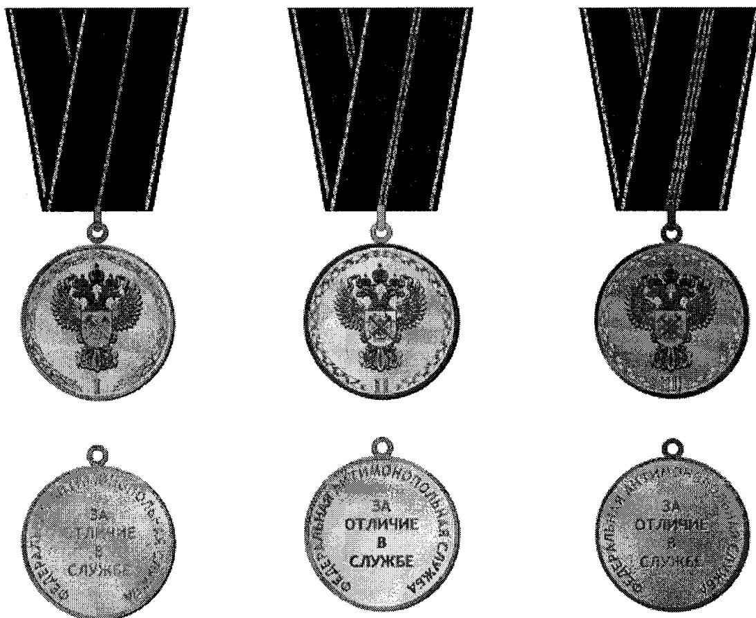
РИСУНОК Медали Федеральной антимонопольной службы "За отличие в службе"

Приложение N 2 к Положению о Медали Федеральной антимонопольной службы "За отличие в службе", утвержденному