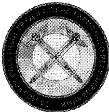
РИСУНОК Знака Федеральной антимонопольной службы "За добросовестный труд в сфере тарифного регулирования"

Знак ФАС России имеет на оборотной стороне приспособление для крепления к одежде.