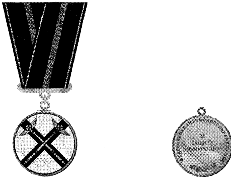
РИСУНОК Медали Федеральной антимонопольной службы "За защиту конкуренции"

Приложение N 5 к приказу ФАС России от 11.03.2019 N 273/19