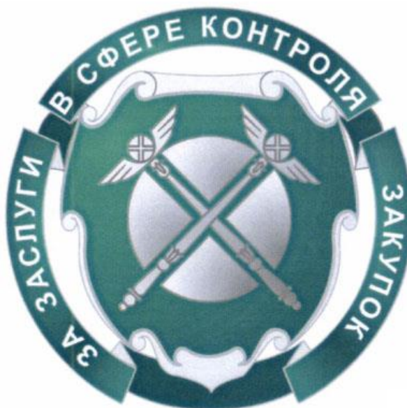
РИСУНОК Знака Федеральной антимонопольной службы "За заслуги в сфере контроля закупок"

Знак ФАС России имеет на оборотной стороне приспособление для крепления к одежде.