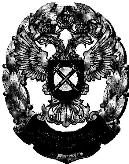
РИСУНОК нагрудного знака "Почетный работник антимонопольных органов России"

Приложение N 3 к приказу ФАС России от 11.03.2019 N 273/19